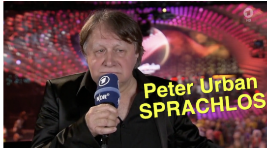
Eurovision Song Contest