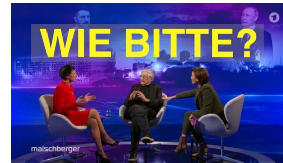
Wagenknecht vs. Baum