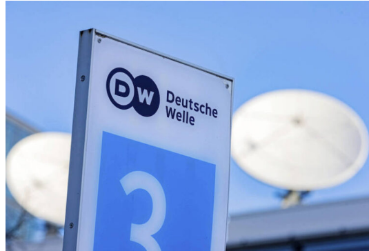
Nach Antisemitismus-Vorwürfen gegen Mitarbeiter „Die Deutsche Welle sollte sich offiziell und öffentlich entschuldigen“