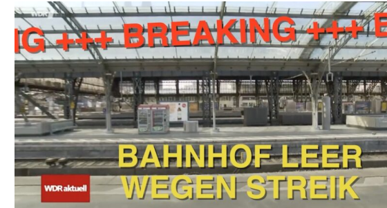
Bahnhof leer wegen Streik

„Das ist die ganz, ganz große Show“: Medien folgen Donald Trump auf Schritt und Tritt