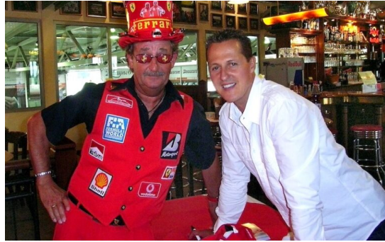
Fast zehn Jahre nach Schumachers Unfall „Weshalb lassen Medien den Michael und seine Familie nicht in Ruhe? Ich weiß nicht, warum das so schwer ist“