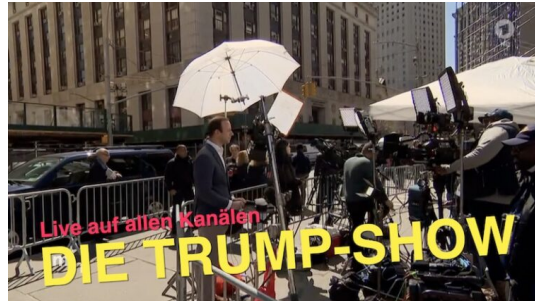
Ex-Präsident vor Gericht

„Das ist die ganz, ganz große Show“: Medien folgen Donald Trump auf Schritt und Tritt