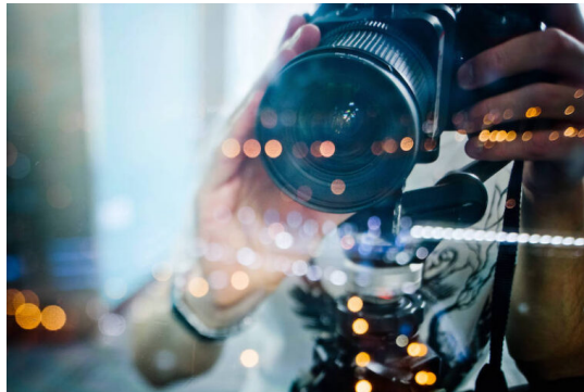
Wieso ist das so? (15)

„Wir müssen Formate machen, die Zuschauer:innen dazu bringen, wütende Briefe in Sütterlin zu schreiben“